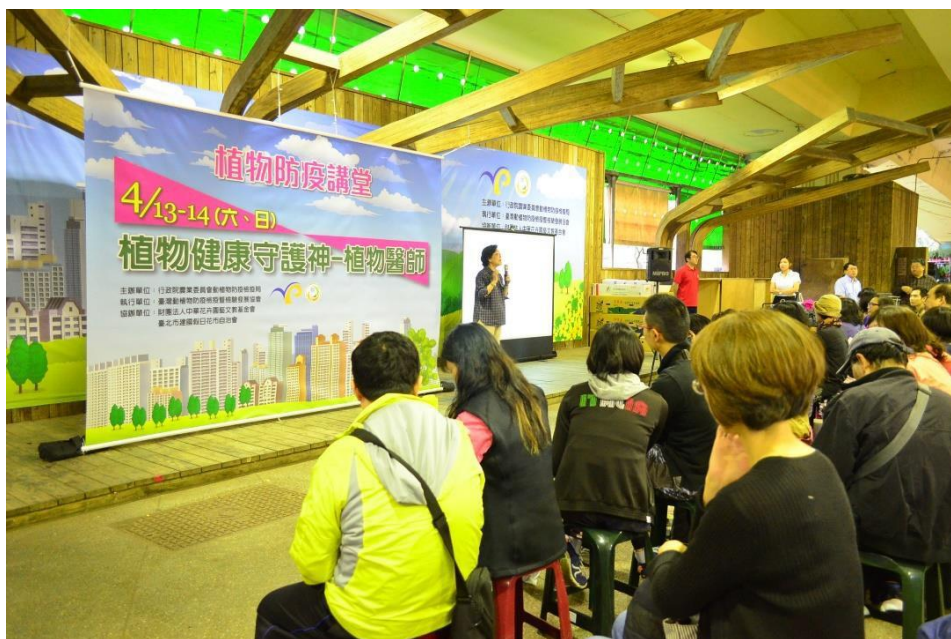
圖 4、於臺北市假日建國花市舉辦「植物防疫講堂」，增加民眾對植物醫師的認識。