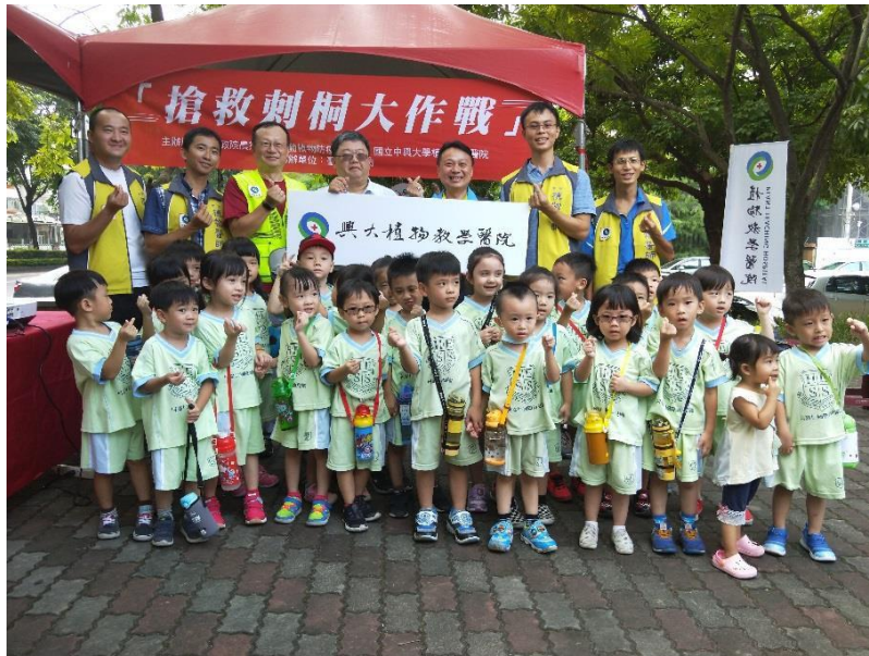
圖 3、中興大學植物教學醫院辦理「刺桐紬小蜂防治成果說明會」。