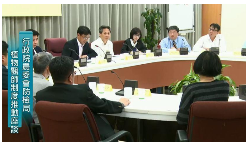
圖 1、防檢局邀請農企業、公民團體及四所大學植物保護相關科系專家學者，共同參與植物醫師制度推動座談會。