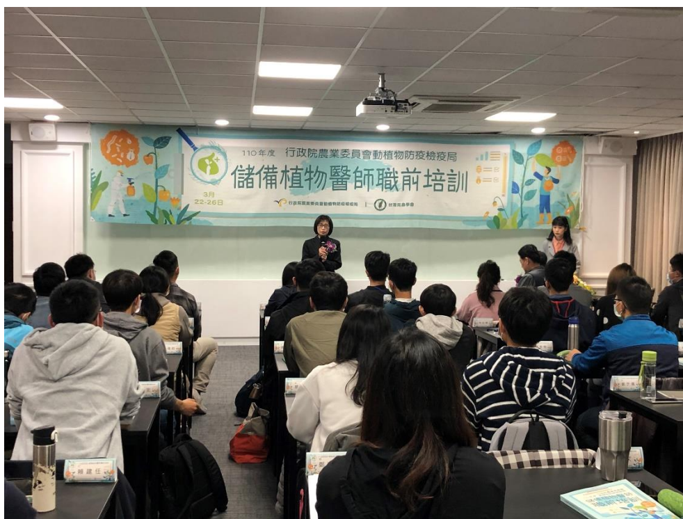
圖 6、於臺中市霧峰區議蘆會館舉辦「儲備植物醫師職前培訓」課程，強化專業人力培訓。