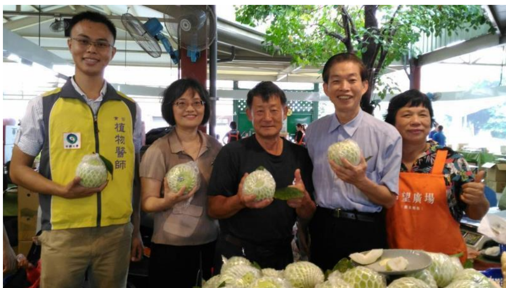
圖 5、媒體報導：植物醫師產地輔導農民在希望廣場展售優質農產品。