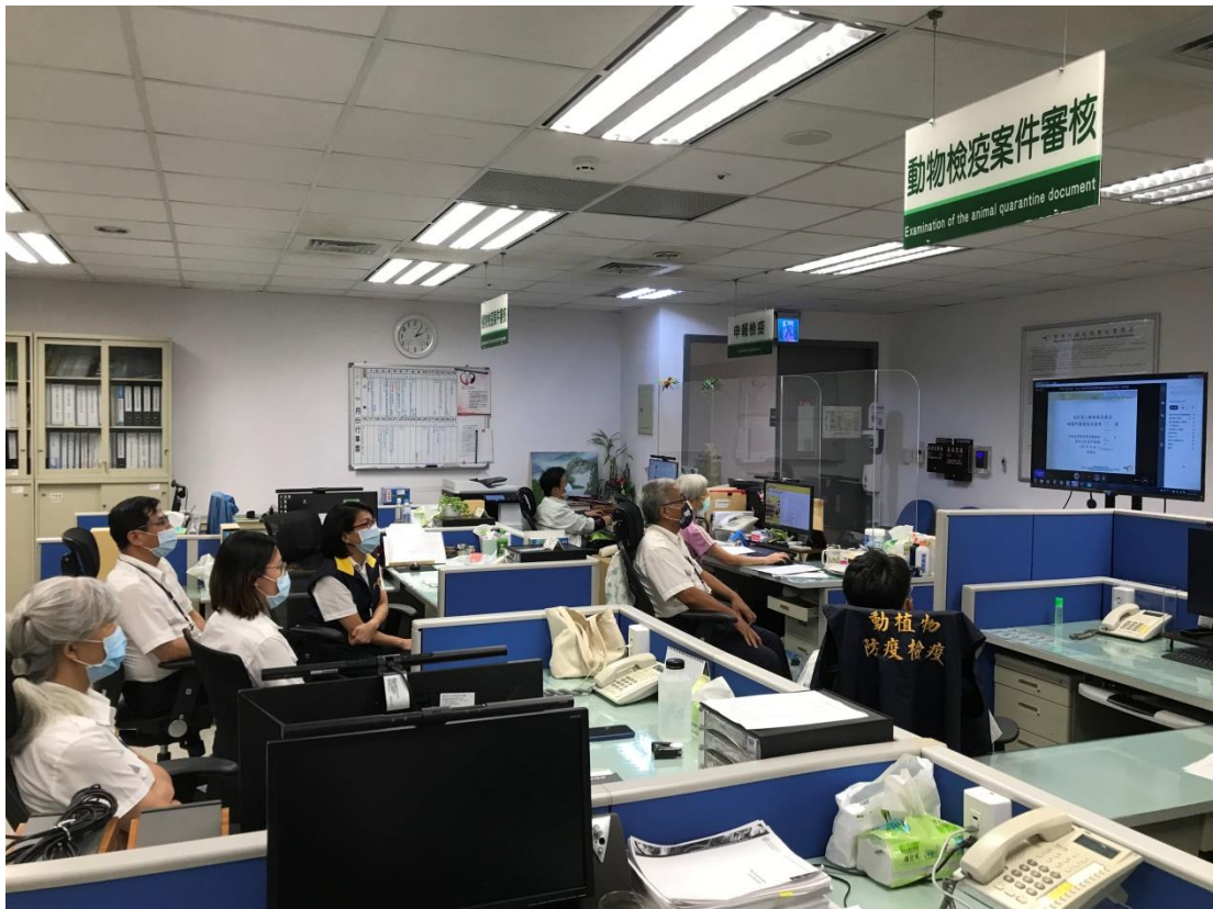
「走私沒入動物與其產品相關防護措施及處理注意事項」專題上課情形