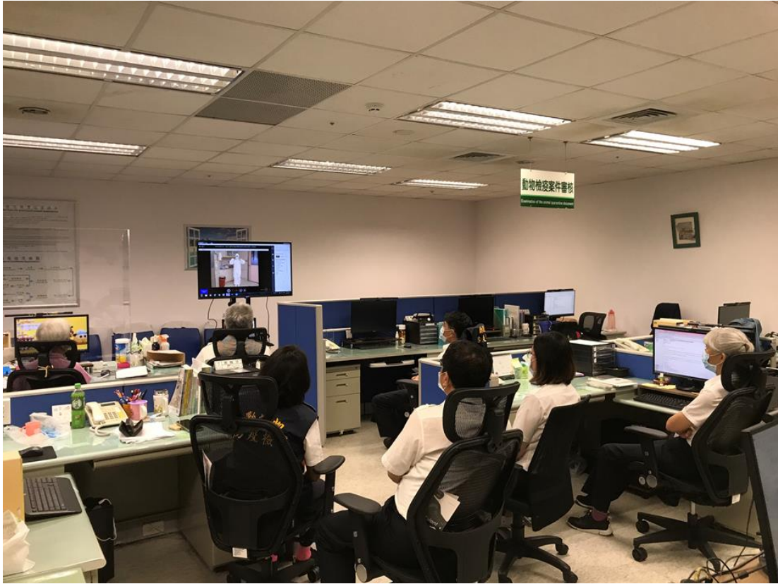
講解防護裝備之穿戴與卸除