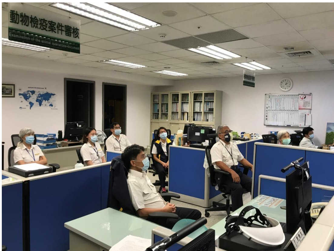
「走私沒入動物與其產品相關防護措施及處理注意事項」專題上課情形