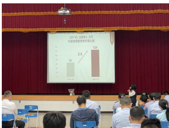
圖 3. 宣導小組成員介紹常見違規攜入動植物檢疫物。