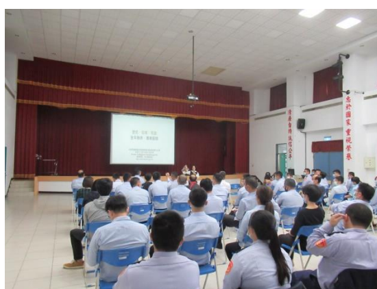
圖 4. 學員於有獎徵答活動搶答。