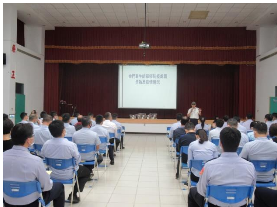
圖 1. 宣導小組成員介紹動物疾病防疫處置作為及疫情。

農畜產品實體模型、檢疫犬布偶加深新住民及一般民眾印象，並發送宣導資料夾提醒與會民眾相關規定及現場解決疑問。