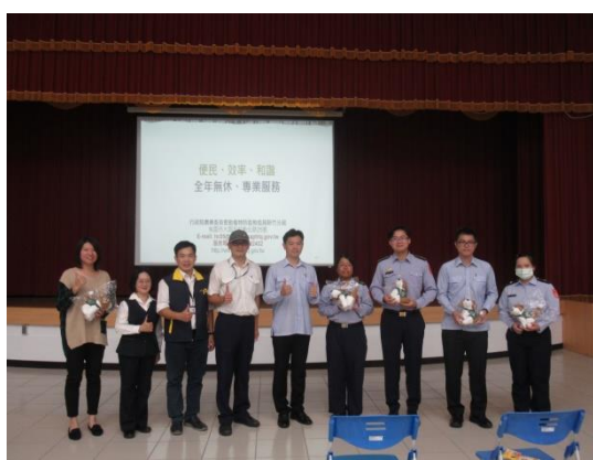
圖 6. 宣導小組成員現場合影。