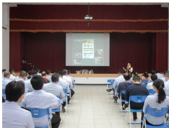
圖 2. 宣導小組成員介紹非洲豬瘟與肉品屠宰衛生簡介。