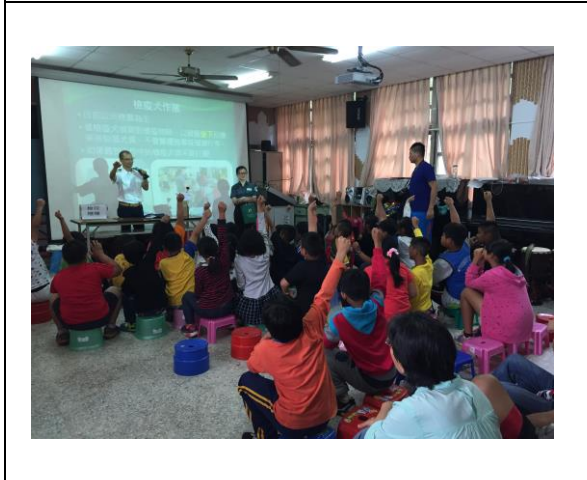
圖 5. 新鄉國小同學熱烈參與有獎徵答。