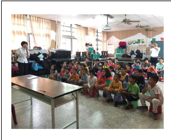
圖 1. 新鄉國小同學專心聆聽宣導小組解說內容。