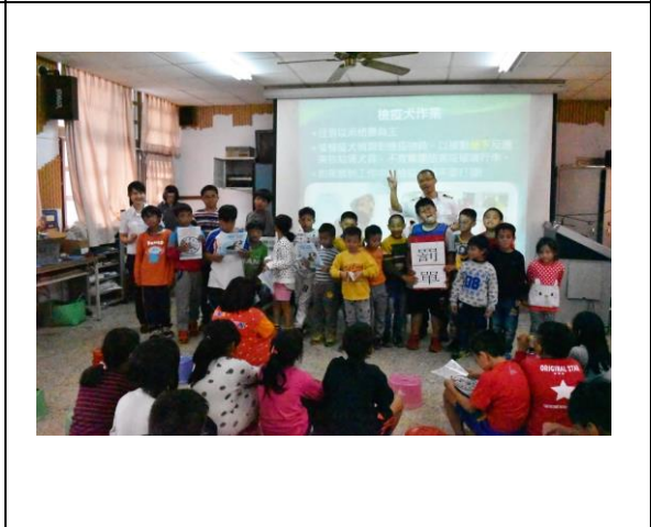
圖 4. 新鄉國小同學演出檢疫小劇場後合照。