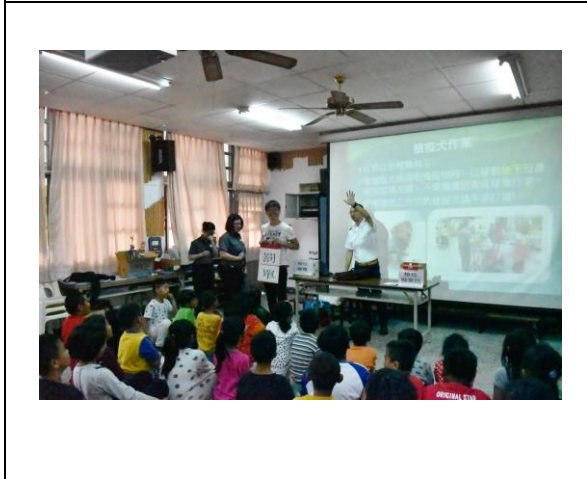
圖 3. 新鄉國小老師配合演出檢疫小劇場, 同學們反應熱烈。