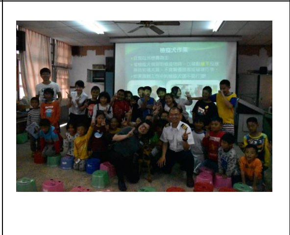
圖 6. 新鄉國小與宣導小組合照。