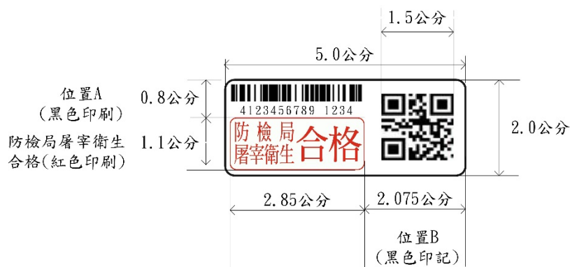
丙式屠宰衛生檢查合格標誌