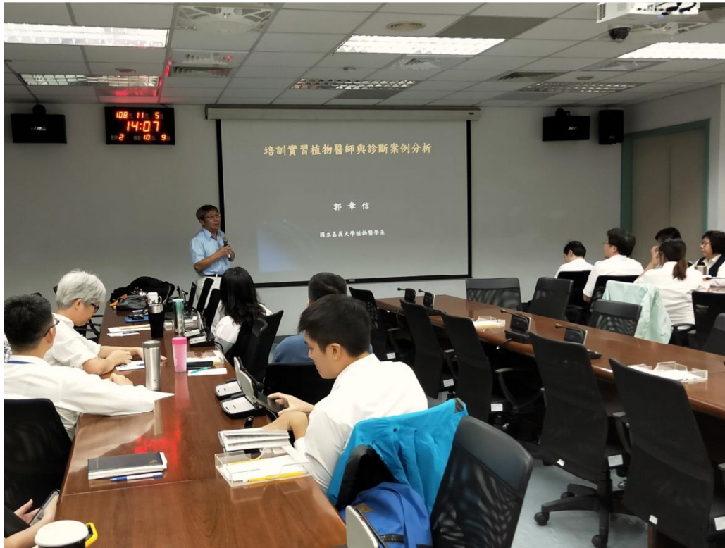
郭教授兼系主任章信授課情形